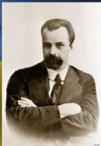
Володимир Кирилович Вишвіченко голова Генерального Секретаріату Української Центральної Ради

22 січня 1919 року-день урочистого оголошення на Софійському майдані в Києві універсалу про об'єднання УНР і ЗУНР у соборну Україну