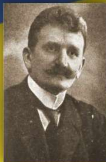
Євген Омелянович Петрушевич український громадсько- політичний діяч президент Західноукраїнської Народної Республіки