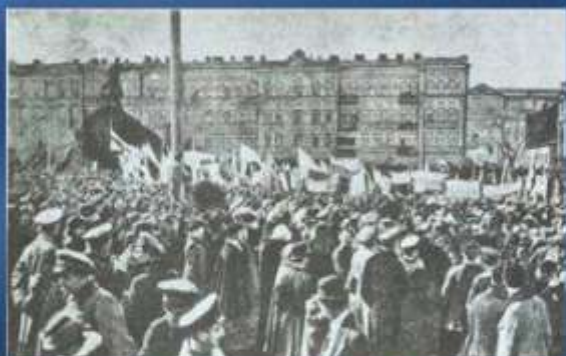
Момент оголошення Акту Злуки УНР та ЗУНР у єдину країну. 22 січня 1919 року.

22 січня 1919 року-день урочистого оголошення на Софійському майдані в Києві універсалу про об'єднання УНР і ЗУНР у соборну Україну